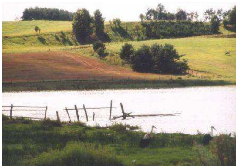
Ryc. Jezioro w Kamienicy Królewskiej

Obszar gminy położony jest w obrębie czterech dorzeczy: