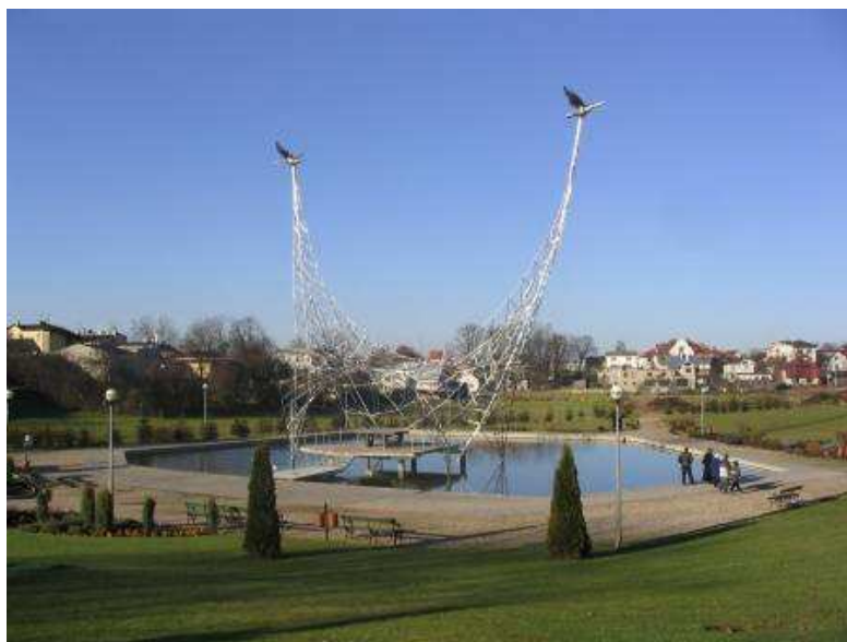
Ryc. Park w Sierakowicach i Ołtarz Papieski

Bogactwo naturalne gminy w postaci licznych jezior, czy obiektów krajobrazowo-przyrodniczych o wysokich walorach, dają w perspektywie możliwości rozwoju turystyki i rekreacji, która obecnie traktowane są jako uzupełnienie działalności rzemieślniczej oraz usługowo-rolniczej.