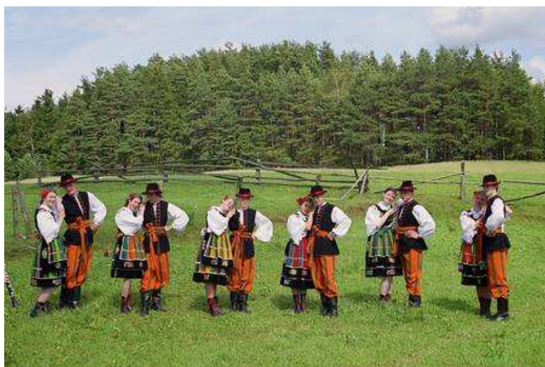
Ryc. Kaszubski Zespół Pieśni i Tańca „Sierakowice”

Liczba mieszkańców gminy Sierakowice kształtuje się obecnie w granicach 16.798 osób w tym około 6.453 osób zamieszkuje Sierakowice.