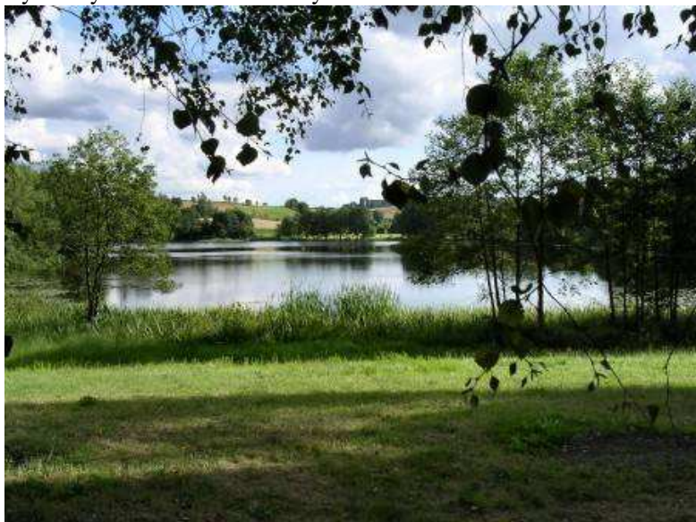
Ryc. Przyroda na terenie Gminy Sierakowice

Naturalne, nieskażone środowisko, czyste powietrze, spokój, swoisty mikroklimat bogaty w lasy i zbiorniki wodne, obfitość grzybów i jagód w lasach, brak uciążliwych zakładów produkcyjnych gwarantuje wspaniałe możliwości wypoczynkowe i rekreacyjne na terenie Gminy Sierakowice. W Gminie znaleźć można mnóstwo jezior, stwarzających dogodne warunki do wędkowania i wypoczynku.